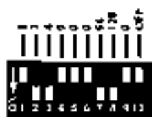
FRAMPHIC:0 IMPOSTAZIONE DEI COMUTATORI DIP SU 166 (2+4+8+1+3)